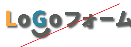
装飾（影・立体・光彩表示）