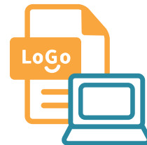
YAMABUKI & SHINBASHI ver.